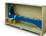
Färdigt förmonterad i transportlåda